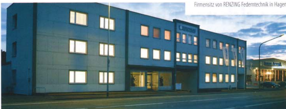
Firmensitz von RENZING Federertechnik in Hagen.