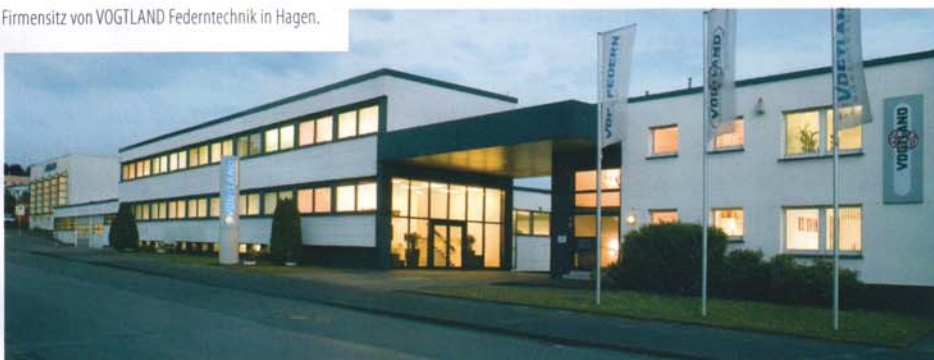
Firmensitz von VOGTLAND Federertechnik in Hagen.

zählen - vertrauen auf die Kompetenz und Erfahrung der Unternehmensgruppe, die jeweils für den speziellen Anwendungsfall optimale Feder zu konstruieren. Das umfangreiche Produktprogramm ist auch ein