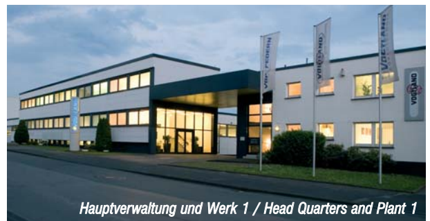
Hauptverwaltung und Werk 1 / Head Quarters and Plant 1

VDF VOGTLAND Federntechnik GmbH Alemannenweg 25-27 • 58119 Hagen Telefon + 49 2334 801-0 • Fax + 49 2334 801-17 E-Mail: info@vdf-federn.de