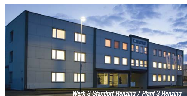
Werk 3 Standort Renzing / Plant 3 Renzing

RENZING GmbH Federntechnik Elseyer Str. 63 • 58119 Hagen Telefon + 49 2334 95 87-0 • Fax + 49 2334 52 78 9 E-Mail: service@renzing-federn.de