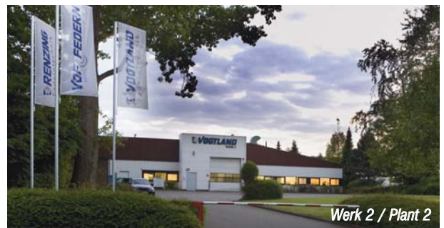
Werk 2 / Plant 2

VOGTLAND Autosport GmbH Alemannenweg 25-27 • 58119 Hagen Telefon + 49 2334 801-36 • Fax + 49 2334 801-24 E-Mail: vertrieb@vogtland.com